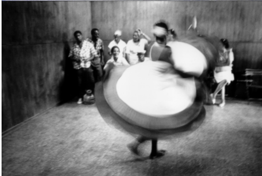
Antonio Guerrero (cuban5): Grafik in Gefangenschaft – sie wandeln Dich in eine Nummer arbeiterfotografie: Havanna und Pinar del Rio (Casa del Cultura) , 1992

Auf dem Balkon Deiner Träume, in dem Baum an der Ecke, an der Tür, die meine Tür ist, binde ein gelbes Band.